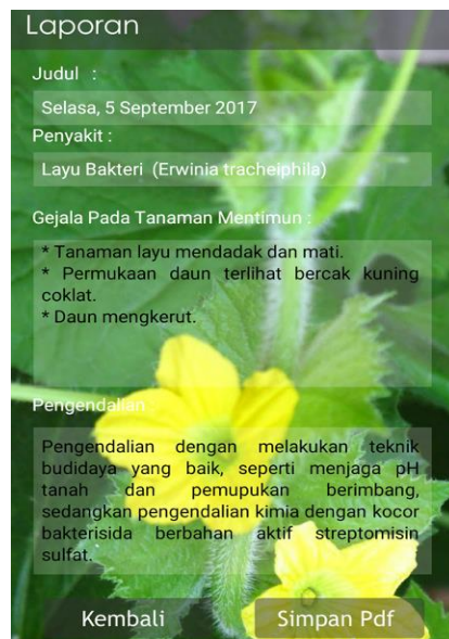
Gambar 3 Tampilan Hasil Diagnosa