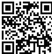
Gambar 4. File Pendaftaran

Langkah selanjutnya, pendaftar melakukan daftar ulang dengan membawa file pendaftaran dan menyerahkannya kepada admin. Sebelum admin melakukan verifikasi, admin harus terlebih dahulu melakukan login . Adapun tampilan halaman login dilihat pada gambar 5 berikut :