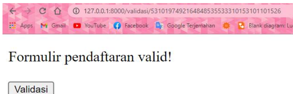
Gambar 6. Halaman Validasi File Pendaftaran

Selanjutnya untuk melakukan pemeriksaan keabsahan file pendaftaran online maka dilakukan proses verifikasi yang dilakukan oleh admin dengan cara mengscan QRCode yang ada pada file pendaftaran. Proses verifikasi ini dilakukan untuk mengetahui bahwa dokumen masih terjaga integritas nya atau tidak. Ketika dilakukan proses validasi file pendaftaran online maka sistem akan memvalidasi keabsahan dokumen dengan memberikan informasi “Formulir Pendaftaran Valid” dan admin dapat mengklik tombol validasi agar datanya sudah tervalidasi pada database . Adapun hasilnya pada gambar 6 sebagai berikut :