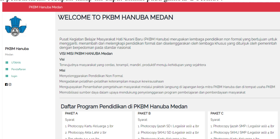
Gambar 2. Akses Halaman Utama

Pada kasus ini akan dilihat bagaimana sistem dapat dijalankan sebagai mana fungsinya yaitu mengakses halaman menu utama, mengklik menu pendaftaran, melakukan pendaftaran dan sistem melakukan tanda tangan dokumen (enkripsi) serta admin memverifikasi dokumen (dekripsi). Pada tahap awal implementasi, pendaftar mengakses menu utama, selanjutnya mengakses menu pendaftaran dan melakukan pendaftaran pada halaman pendaftaran. Adapun tahap ini dapat dilihat pada gambar 2 berikut :