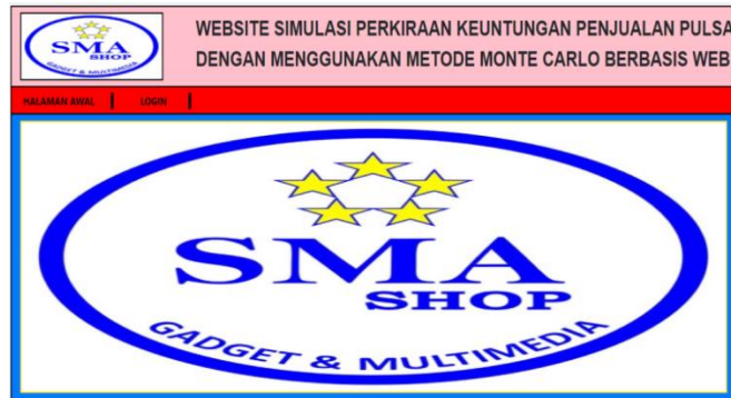
Gambar 3.3 Tampilan Menu Utama

Berikut ini merupakan tampilan dari form menu utama yang merupakan tampilan yang akan dikunjungi oleh user sebelum login