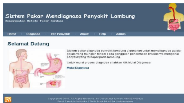
Gbr 2. Page Utama Sistem Pakar Penyakit Lambung

Page utama atau halaman selamat datang merupakan halaman yang pertama tampil ketika pengguna mengakses halaman sistem pakar Lambung. Pada bagian utama halaman ini terdapat menu utama seperti home , diagnosa , info penyakit , about , help dan admin . Bagi pasien yang akan mendiagnosa penyakit dapat langsung menklik tombol mulai diagnosa yang akan diarahkan langsung kebagian registrasi pasien. Adapun tampilannya dapat dilihat pada gambar 2 berikut :