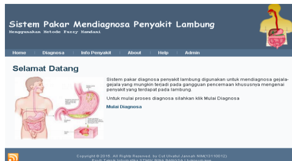
Gbr 2. Page Utama Sistem Pakar Penyakit Lambung

Page utama atau halaman selamat datang merupakan halaman yang pertama tampil ketika pengguna mengakses halaman sistem pakar Lambung. Pada bagian utama halaman ini terdapat menu utama seperti home , diagnosa , info penyakit , about , help dan admin . Bagi pasien yang akan mendiagnosa penyakit dapat langsung menklik tombol mulai diagnosa yang akan diarahkan langsung kebagian registrasi pasien. Adapun tampilannya dapat dilihat pada gambar 2 berikut :