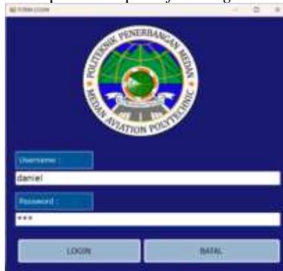
Gambar 2. Tampilan Form Login

Sebelum masuk kedalam aplikasi, admin harus melakukan login terlebih dahulu dengan cara input username dan password dengan benar. Di bawah ini merupakan tampilan form login adalah sebagai berikut :