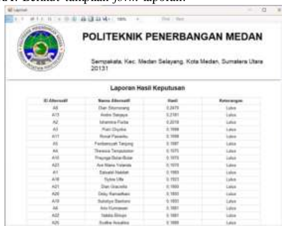
Gambar 7. Form Laporan

Form Laporan digunakan untuk menampilkan hasil dari proses perhitungan pada data alternatif dan data kriteria menggunakan metode MOORA. Berikut tampilan form laporan.