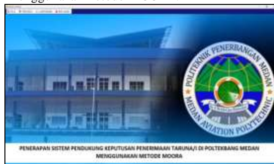
Gambar 3. Form Menu Utama

Halaman menu utama adalah tampilan awal dari sistem untuk melakukan pengolahan data didalam sistem pendukung keputusan penerimaan taruna/I menggunakan metode MOORA.