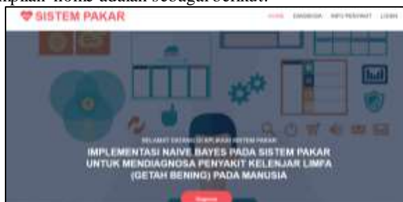
Gambar 1. Tampilan home

Di bawah ini merupakan tampilan home adalah sebagai berikut: