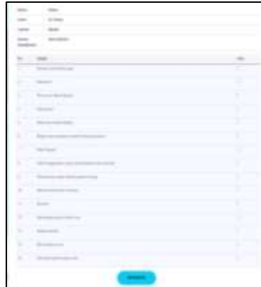
Gambar 8. Tampilan menu proses