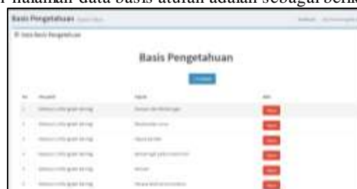
Gambar 6. Tampilan data basis aturan