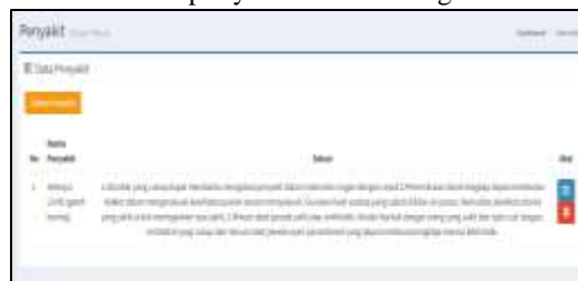
Gambar 4. Tampilan data penyakit