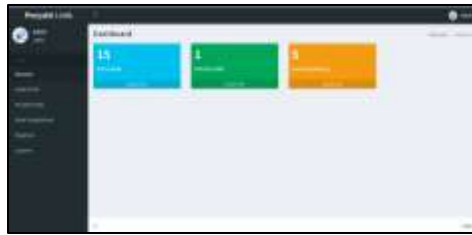
Gambar 3. Tampilan menu utama