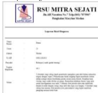
Gambar 9. Tampilan laporan