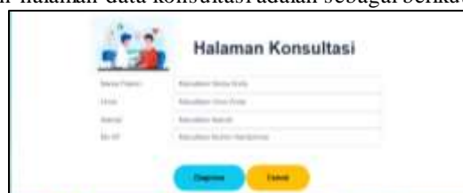
Gambar 7. Tampilan menu konsultasi