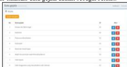
Gambar 5. Tampilan data gejala