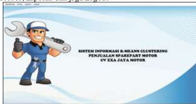
Gambar 2. Halaman Menu Utama

Halaman ini berisi halaman pertama yang akan diakses sesudah pengguna melakukan login dan menampilkan berbagai menu yaitu Data Barang, Proses, Laporan dan juga Logout