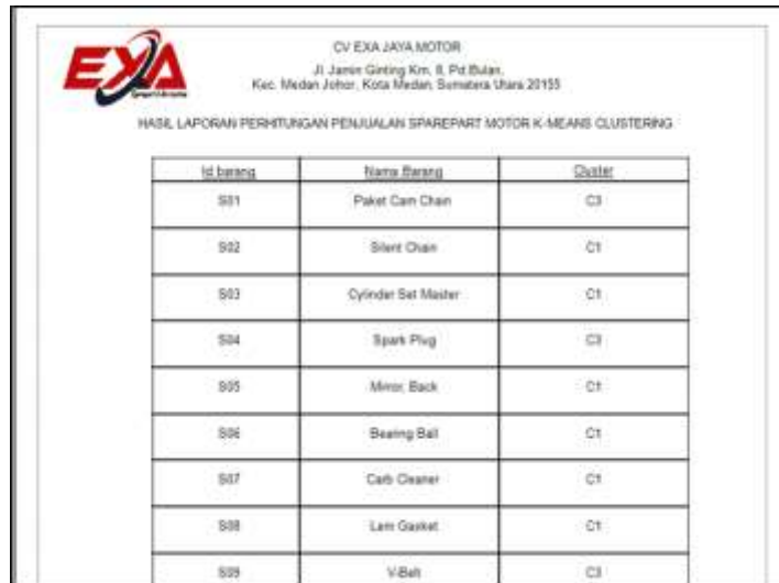
Gambar 6. Halaman Data Laporan

Halaman ini akan berisi hasil laporan dari perhitungan K-Means clustering .