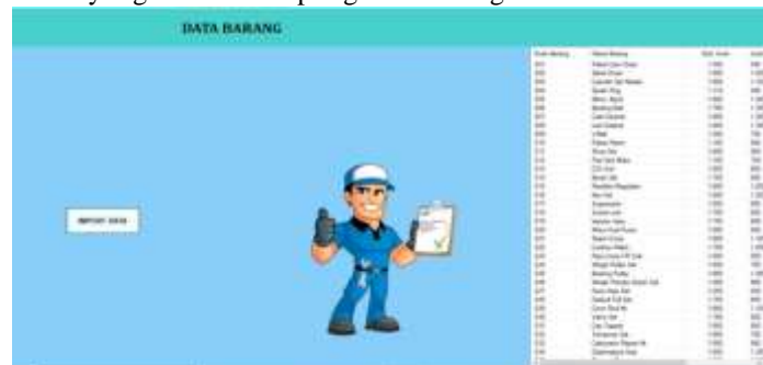
Gambar 3. Halaman Data Barang

Halaman merupakan halaman yang akan menampilkan data barang dari database