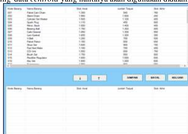
Gambar 4. Halaman Data Centroid

Halaman ini akan menampilkan data centroid yang nantinya akan digunakan didalam perhitungan sistem