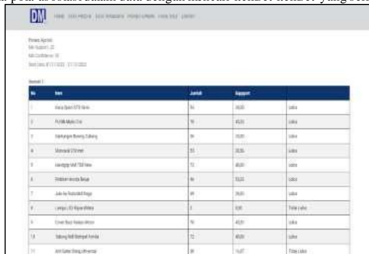
Gambar 5. Halaman Proses Apriori