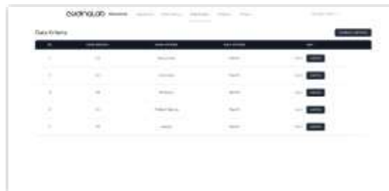
Gambar 6. Tampilan Halaman Data Kriteria Manager Talent

Berikut ini pada halaman data kriteria Manager Talent terdapat proses penambahan, perubahan, dan penghapusan data kriteria yang digunakan dalam proses perhitungan metode Preference Selection Index (PSI). Berikut adalah tampilan halaman data kriteria Manager Talent pada sistem, sebagai berikut: