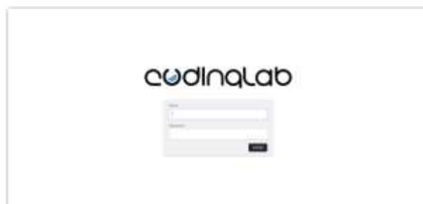
Gambar 1. Tampilan Halaman Login Manager Talent dan CEO