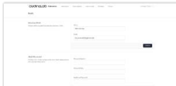
Gambar 13. Tampilan Halaman Data Profil Manager Talent

Berikut ini adalah tampilan halaman data profil Manager Talent yang berfungsi untuk menampilkan dan mengubah data profil yang tersimpan dalam database . Berikut adalah tampilan halaman data profil Manager Talent pada sistem, sebagai berikut: