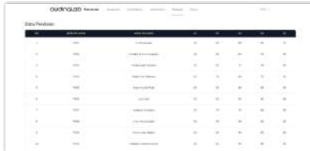
Gambar 9. Tampilan Halaman Data Penilaian CEO

Berikut ini pada halaman data penilaian CEO merupakan halaman yang menampilkan data nilai dari data pelamar yang digunakan dalam proses perhitungan metode Preference Selection Index (PSI). Berikut adalah tampilan halaman data penilaian CEO pada sistem, sebagai berikut: