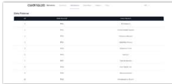
Gambar 5. Tampilan Halaman Data Pelamar CEO