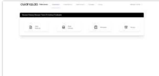
Gambar 2. Tampilan Form Menu Utama

Berikut ini adalah tampilan halaman dashboard untuk Manager Talent pada sistem yang telah dikembangkan, yaitu sebagai berikut: