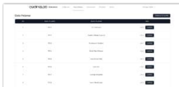
Gambar 4. Tampilan Halaman Data Pelamar Manager Talent

Berikut ini pada data pelamar Manager Talent , terdapat proses penambahan, pengubahan, dan penghapusan data pelamar yang tersimpan dalam database . Berikut adalah tampilan Halaman Data Pelamar Manager Talent pada sistem :