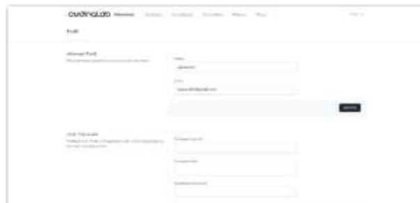
Gambar 14. Tampilan Halaman Data Profil CEO

Berikut ini adalah tampilan halaman data profil CEO yang berfungsi untuk menampilkan dan mengubah data profil yang tersimpan dalam database . Berikut adalah tampilan halaman data profil CEO pada sistem, sebagai berikut: