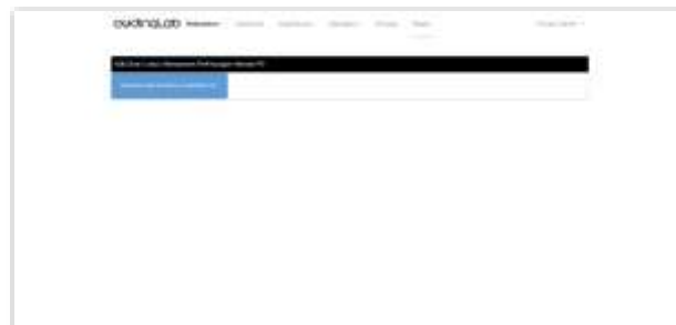
Gambar 10. Tampilan Halaman Proses

Pada halaman proses ini merupakan halaman untuk melakukan pengolahan semua nilai kriteria yang telah dimasukkan dari data pelamar yang digunakan dalam sistem. Berikut adalah tampilan hasil implementasi dari perancangan halaman proses metode PSI.