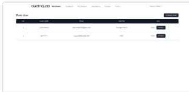
Gambar 15. Tampilan Halaman Data User Manager Talent