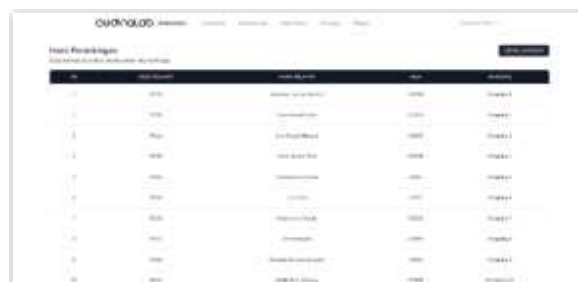
Gambar 11. Tampilan Halaman Hasil Proses Manager Talent

Pada tampilan halaman ini, hanya terdapat satu tombol yang digunakan untuk memulai proses perhitungan metode PSI. Setelah tombol tersebut ditekan, akan tampil halaman berikut :