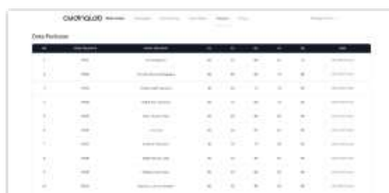
Gambar 8. Tampilan Halaman Data Penilaian Manager Talent

Berikut ini pada halaman data penilaian Manager Talent terdapat proses penambahan atau perubahan nilai data pelamar yang akan diproses selanjutnya menggunakan metode Preference Selection Index (PSI). Berikut adalah tampilan halaman data penilaian Manager Talent pada sistem, sebagai berikut: