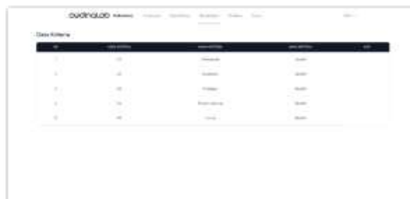
Gambar 7. Tampilan Halaman Data Kriteria CEO

Berikut ini pada halaman data kriteria CEO merupakan halaman yang menampilkan data kriteria yang digunakan dalam proses perhitungan metode Preference Selection Index (PSI). Berikut adalah tampilan halaman data kriteria CEO pada sistem sebagai berikut: