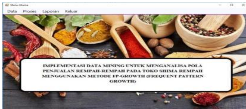
Gambar 3. Form Menu Utama