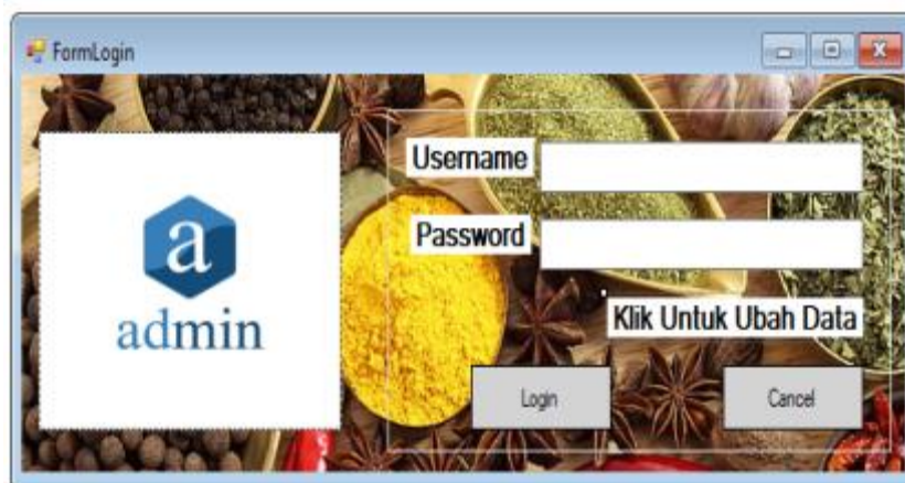
Gambar 1. Form Login

Form Login digunakan untuk mengamankan sistem dari user-user yang tidak bertanggung jawab sebelum masuk ke Menu Utama. Berikut adalah tampilan Form Login :