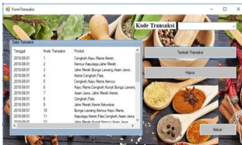
Gambar 5. Form Transaksi

Form Transaksi adalah Form yang digunakan untuk mengelola data Transaksi yang ada pada Toko Shima Rempah. Berikut adalah tampilan form Data Transaksi: