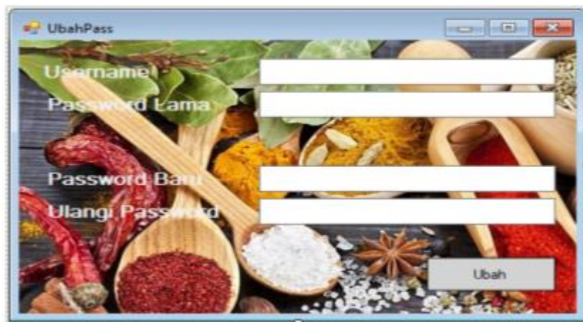
Gambar 2. Form Ubah Password

Form Ubah Pass digunakan untuk mengubah data password . Berikut adalah tampilan Form Ubah Password :