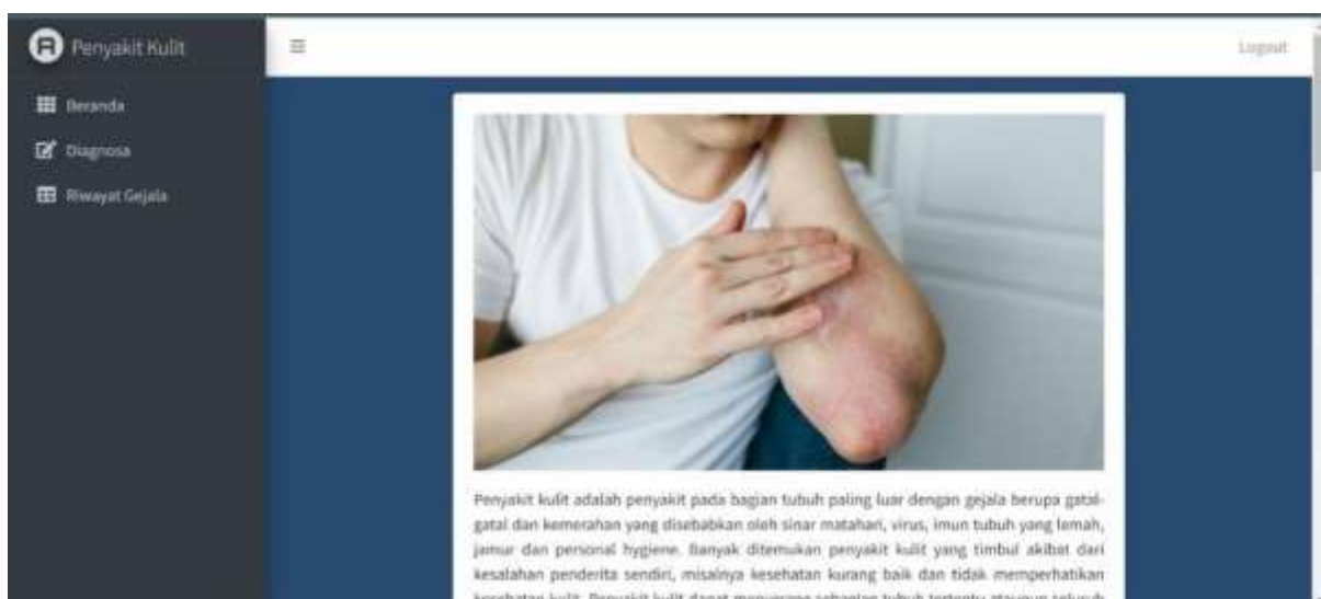
Gambar 3. Tampilan menu beranda