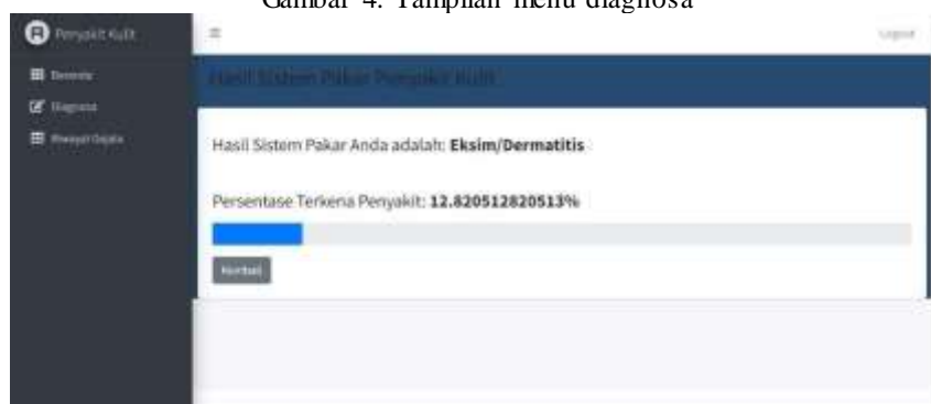
Gambar 5. Tampilan hasil diagnose