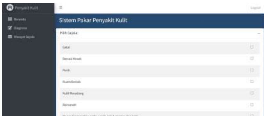
Gambar 4. Tampilan menu diagnosa