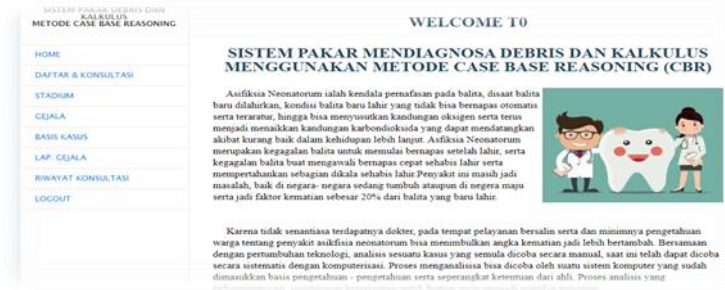
Gambar 2. Menu Utama

Menu utama digunakan sebagai penghubung untuk menu gejala, kerusakan dan rule base. Berikut adalah tampilan menu utama: