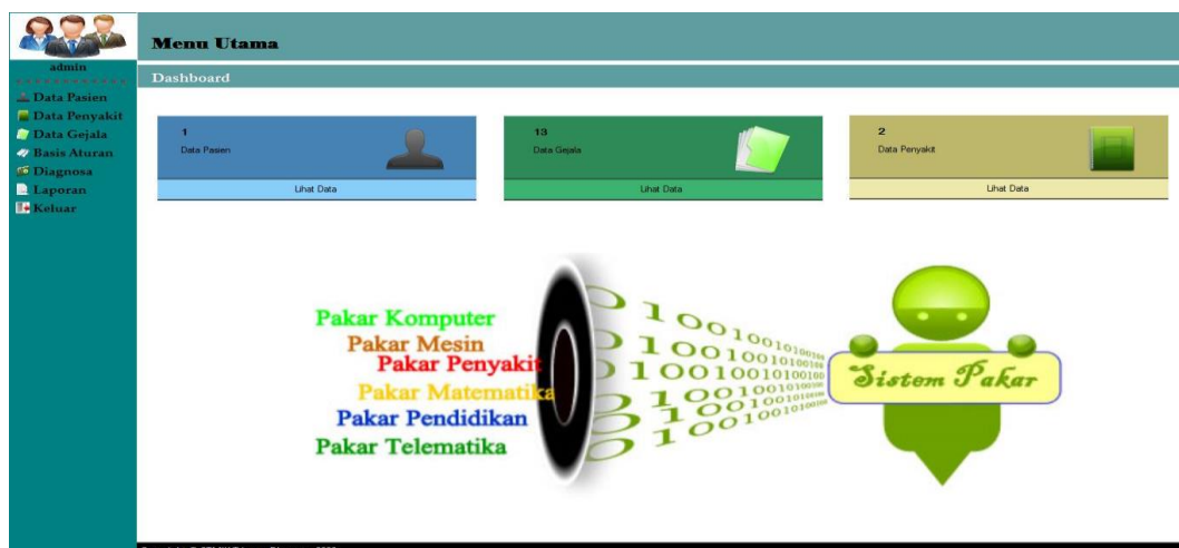
Gambar 4.2 Form Menu Utama

Berikut ini merupakan tampilan menu utama dari sistem pakar untuk mendiagnosa penyakit asam lambung menggunakan metode teorema bayes :