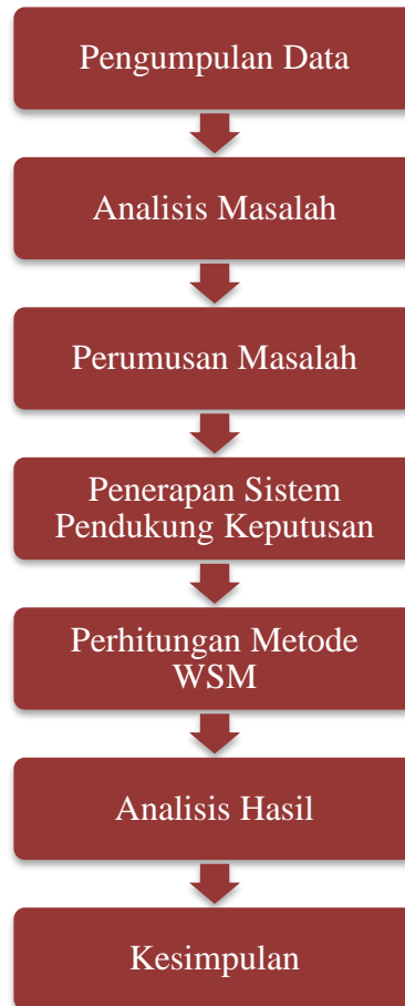
Gambar 2.1 Metode Penelitian

Gambar di atas menjelaskan bagaimana cara melakukan penelitian ini. Hal pertama yang dilakukan adalah perencanaan sampai dengan uji coba eksperimen di Dinas Kesehatan Kabupaten Aceh Tenggara.