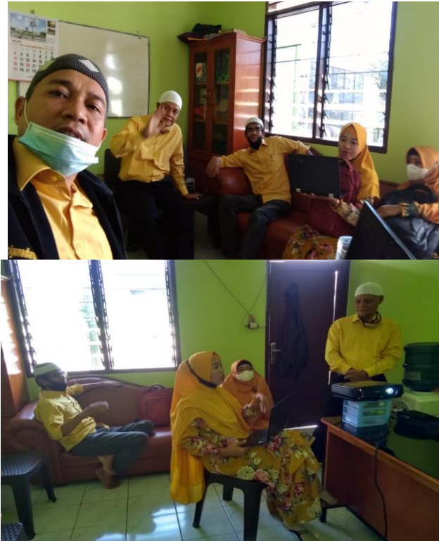
Gambar 2. Fase pelaksanaan kegiatan pada tahap pengarahan

Selanjutnya kegiatan yang dilakukan adalah Implementasi program yang dilakukan ke pihak sekolah untuk mengetahui cara penggunaan program aplikasi dan untuk mengetahui kebutuhan-kebutuhan ataupun kekurangan program agar bisa digunakan pada sekolah ‘Uluwwul Himmah.