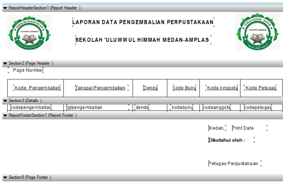
Gambar 6. Aplikasi Cristal report dalam membuat laporan buku perpustakaan

Setelah proses editing atau penyempurnaan program aplikasi perpustakaan sudah selesai tahap selanjutnya yaitu membuat file tersebut dalam bentuk winzip dan menyimpannya ke dalam bentuk DVD, untuk dapat diserahkan ke pihak sekolah agar dapat digunakan oleh pegawai perpustakaan dalam mengelola buku perpustakaan dalam proses peminjaman dan pengembalian buku perpustakaan.