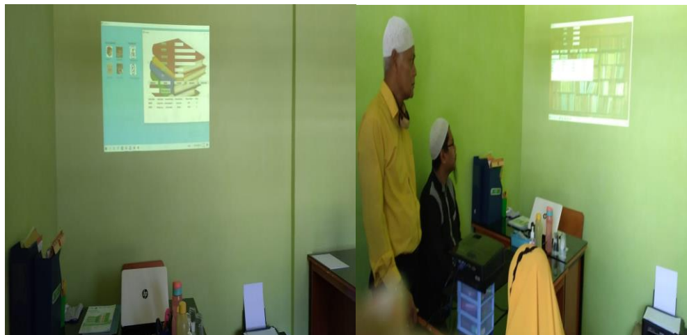
Gambar 3. Kegiatan Implementasi Program

Selanjutnya kegiatan yang dilakukan adalah Implementasi program yang dilakukan ke pihak sekolah untuk mengetahui cara penggunaan program aplikasi dan untuk mengetahui kebutuhan-kebutuhan ataupun kekurangan program agar bisa digunakan pada sekolah ‘Uluwwul Himmah.