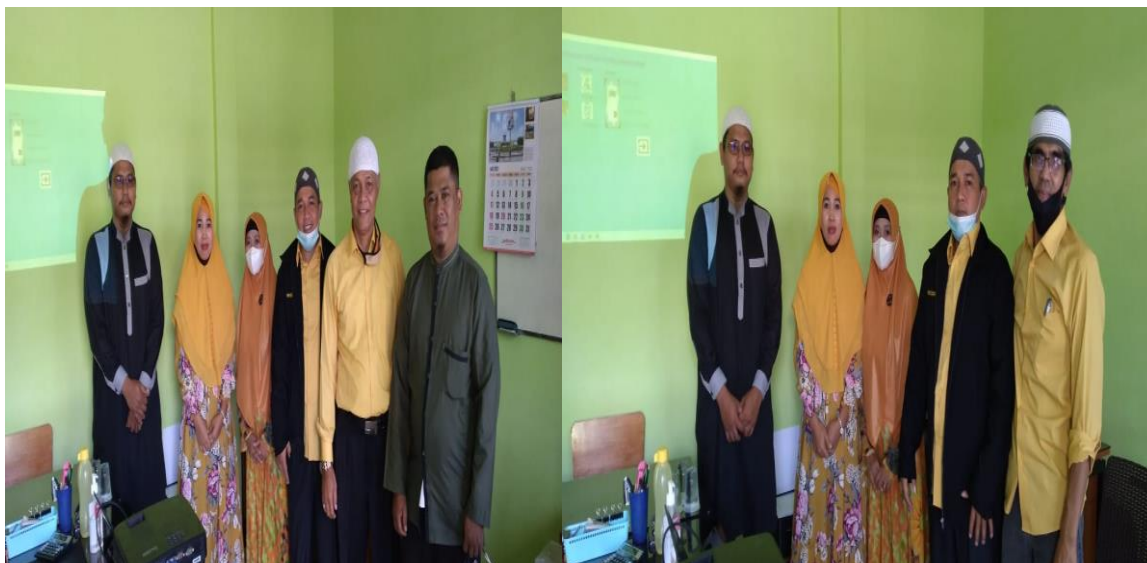
Gambar 4. Kegiatan dokumentasi dalam tahap pelaksanaan kegiatan

Setelah fase kedua (fase pelaksanaan kegiatan) selesai, maka fase ketiga yaitu pasca kegiatan dilakukan dalam tiga tahapan, yaitu evaluasi, produksi dan sharing. Dalam tahapan evaluasi, kegiatan yang dilakukan berupa pengujian program sejauh mana program aplikasi tersebut berjalan secara maksimal, Editing (pengeditan) Program aplikasi dan Crosscek hasil sementara dengan pihak sekolah untuk mendapatkan betuk visualisasi program yang sesuai dengan harapan pihak sekolah untuk dapat digunakan.