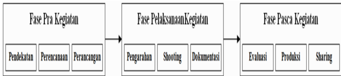
Gambar 1. Fase Kegiatan Pengabdian Masyarakat