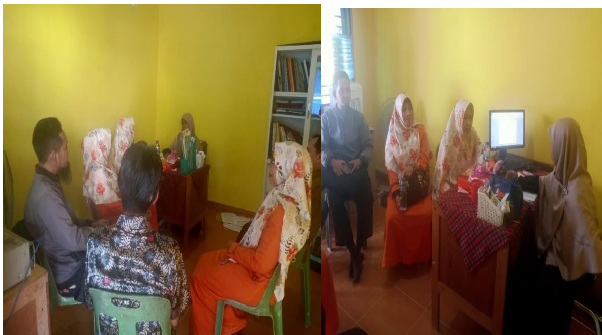
Gambar 2. Fase Pelaksanaan Kegiatan Pada Tahap Pengarahan

Dalam fase Pelaksanaan Kegiatan , dimana tahapan yang dilakukan adalah pengarahan , yaitu mengarahkan para peserta yang bertindak sebagai aktor untuk memposisikan diri agar melakukan aktifitas sesuai skenario yang telah direncanakan sebelumnya.