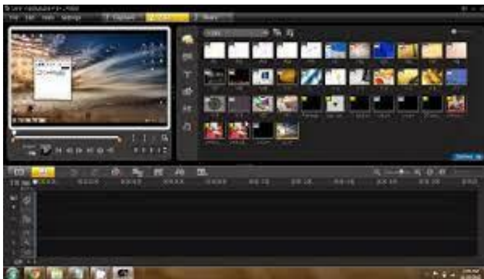
Gambar 6. Kegiatan Pengeditan Pada Fase Pasca Kegiatan Menggunakan Aplikasi Video Editing

Pada kegiatan pengeditan, aplikasi editing yang digunakan terdiri dari Corel Video Studio, yang berfungsi untuk memotong, menambah dan memberikan efek visual pada hasil video.