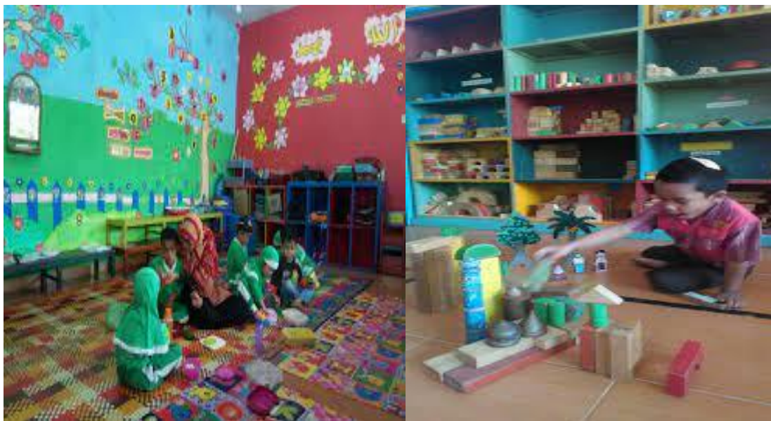
Gambar 3. Kegiatan Shooting Dalam Fase Pelaksanaan

Disela-sela kegiatan shooting dan saat proses shooting telah berakhir, dilakukan pendokumentasian yang bertujuan untuk pembuatan laporan serta sebagai bukti pendukung untuk luaran pelaksanaan kegiatan pengabdian masyarakat.