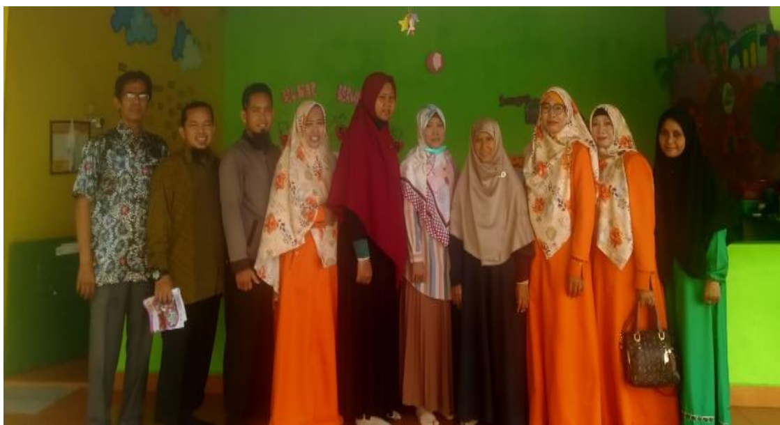
Gambar 4. Kegiatan Dokumentasi Dalam Tahap Pelaksanaan Kegiatan

Disela-sela kegiatan shooting dan saat proses shooting telah berakhir, dilakukan pendokumentasian yang bertujuan untuk pembuatan laporan serta sebagai bukti pendukung untuk luaran pelaksanaan kegiatan pengabdian masyarakat.