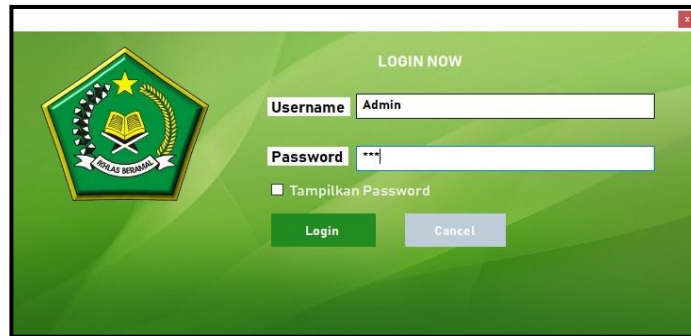
Gambar 1. Tampilan Form Login

Form login berfungsi sebagai validasi akses dari admin untuk masuk kedalam sistem, pada form login terdapat username dan password yang dapat di input sebagai data validasi.