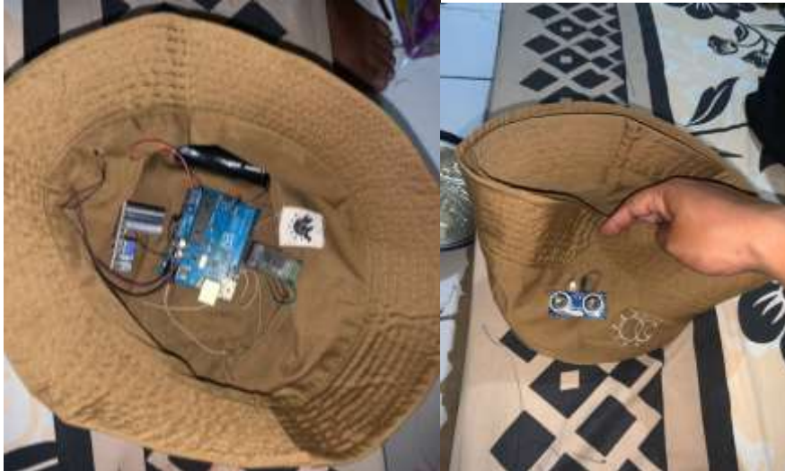
Gambar 5. Gambar Prototipe Alat Peringatan Bahaya Bagi Penyandang Tunanetra

Penting untuk perhatikan bahwa desain topi peringatan bahaya harus mempertimbangkan kenyamanan dan preferensi penyandang tunanetra. Partisipasi mereka dalam proses perancangan dapat memastikan bahwa topi tersebut tidak hanya efektif dalam memberikan peringatan, tetapi juga nyaman dan sesuai dengan kebutuhan sehari-hari. Desain ergonomis dan bahan yang digunakan memastikan kenyamanan pengguna. Ini penting untuk memastikan bahwa topi dapat digunakan sepanjang hari tanpa menyebabkan ketidaknyamanan. Meminimalisir penggunaan komponen juga sebagai pertimbangan agar nantinya tidak memiliki bobot yang berat, karena akan digunakan dikepala.