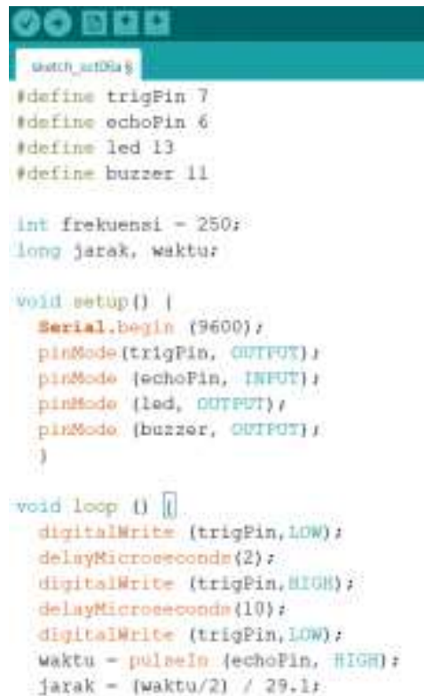
Gambar 4: Tampilan code program pada Arduino

Arduino banyak digunakan dalam pembuatan prototipe berbagai jenis proyek elektronik, termasuk robotika, kendali otomatis, sistem monitoring, semi interaktif. Platform ini menjadi sangat populer karena kemudahannya digunakan, bersifat open-source , dan terjangkau bagi banyak orang. Arduino adalah platform open-source yang digunakan untuk pengembangan prototipe perangkat elektronik. Platform ini mencakup perangkat keras ( board mikrokontroler ) dan perangkat lunak yang memungkinkan pengguna untuk membuat proyek-proyek elektronik dengan mudah.