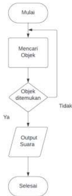
Gambar 1: Flow diagram proses kerja perangkat

Proses kerja topi peringatan bahaya bagi tunanetra dimulai dari sensor ultrasonic yang mendeteksi sebuah objek yang memiliki potensi sebagai penghalang yang berbahaya, setelah sensor memberi masukan ke Arduino maka Arduino akan menilai apakah benar berpotensi bahaya bagi pengguna berdasarkan jarak dan radius dari posisi kepala pengguna, Jika Arduino mendeteksi potensi bahaya maka akan mengirikan sinyal suara ke buzzer untuk meneruskan alarm bahaya sehingga menjadi peringatan bagi pengguna.