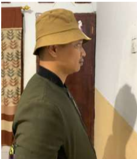
Gambar 6 : Pengujian alat dengan kasus penghalang tembok