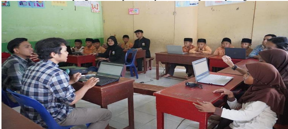
Gambar 2. Dokumentasi untuk pengenalan aplikasi

Dokumentasi Pelaksanaan pengabdian kepada masyarakat ditunjukkan pada gambar di bawah ini.