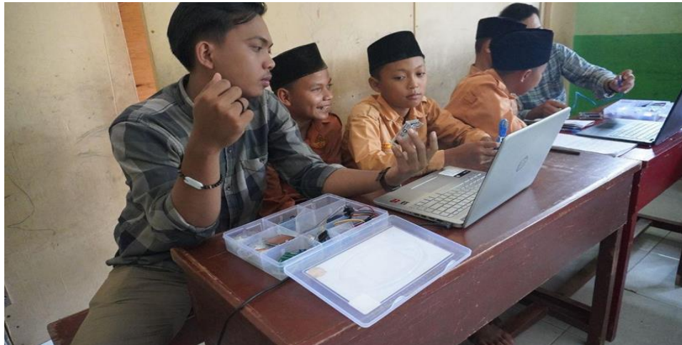
Gambar 4. Dokumentasi Untuk pengenalan Peralatan Arduino