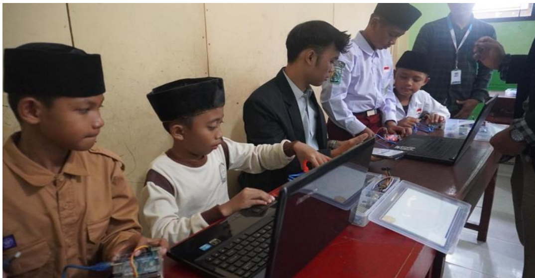
Gambar 5. Dokumentasi Untuk Praktek Menghubungkan Kabel USB dan lampu LED.