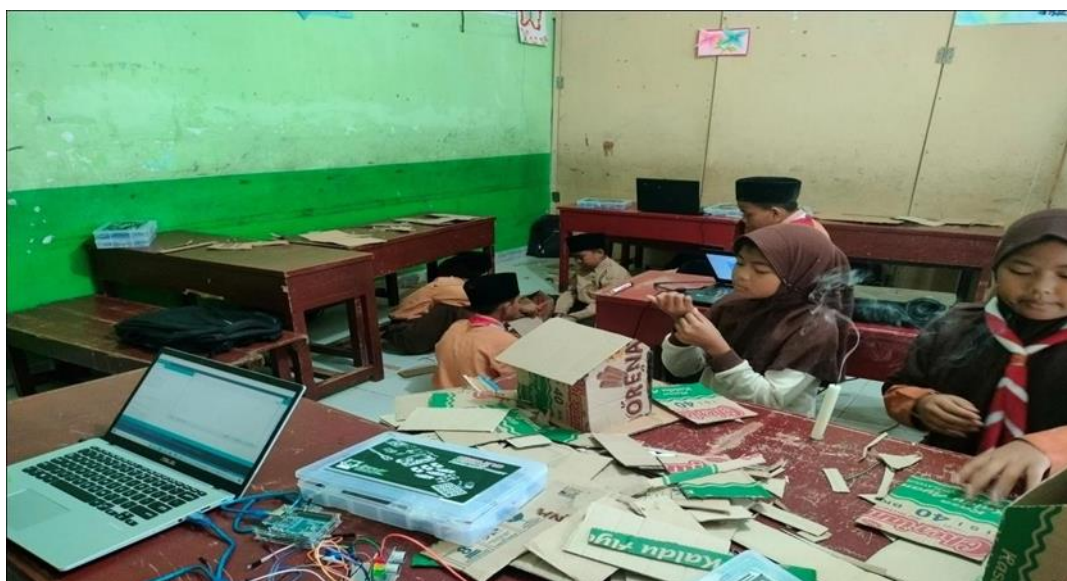
Gambar 6. Pembuatan Sensor Gas Dan Led Otomatis Dengan Bahan Kestas Kardus.